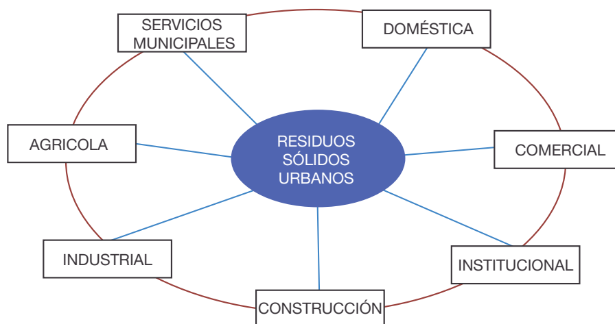
Figura 1 . Fuentes de Residuos Sólidos en la comunidad

Las instalaciones, actividades y localizaciones típicas para la generación de residuos asociados a cada uno de estos orígenes son expuestas en la Figura 1, donde los residuos sólidos urbanos (RSU) normalmente se supone que incluyen a todos los residuos de la comunidad con la excepción de los residuos de procesos industriales y de los residuos agrícolas.